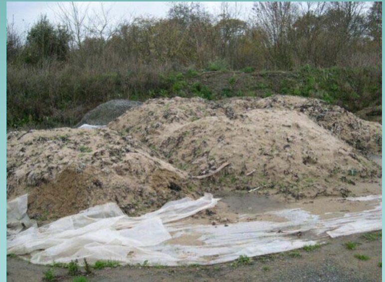
Algues et sédiments stockés dans des centres techniques - Ille-et-Vilaine