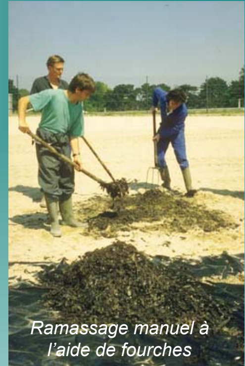
Ramassage manuel à l'aide de fourches