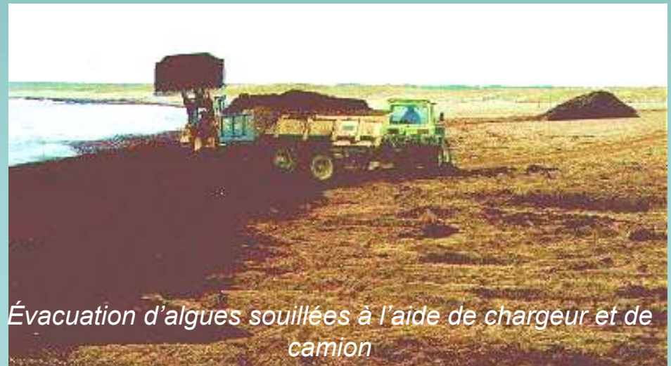
Évacuation d'algues souillées à l'aide de chargeur et de camion